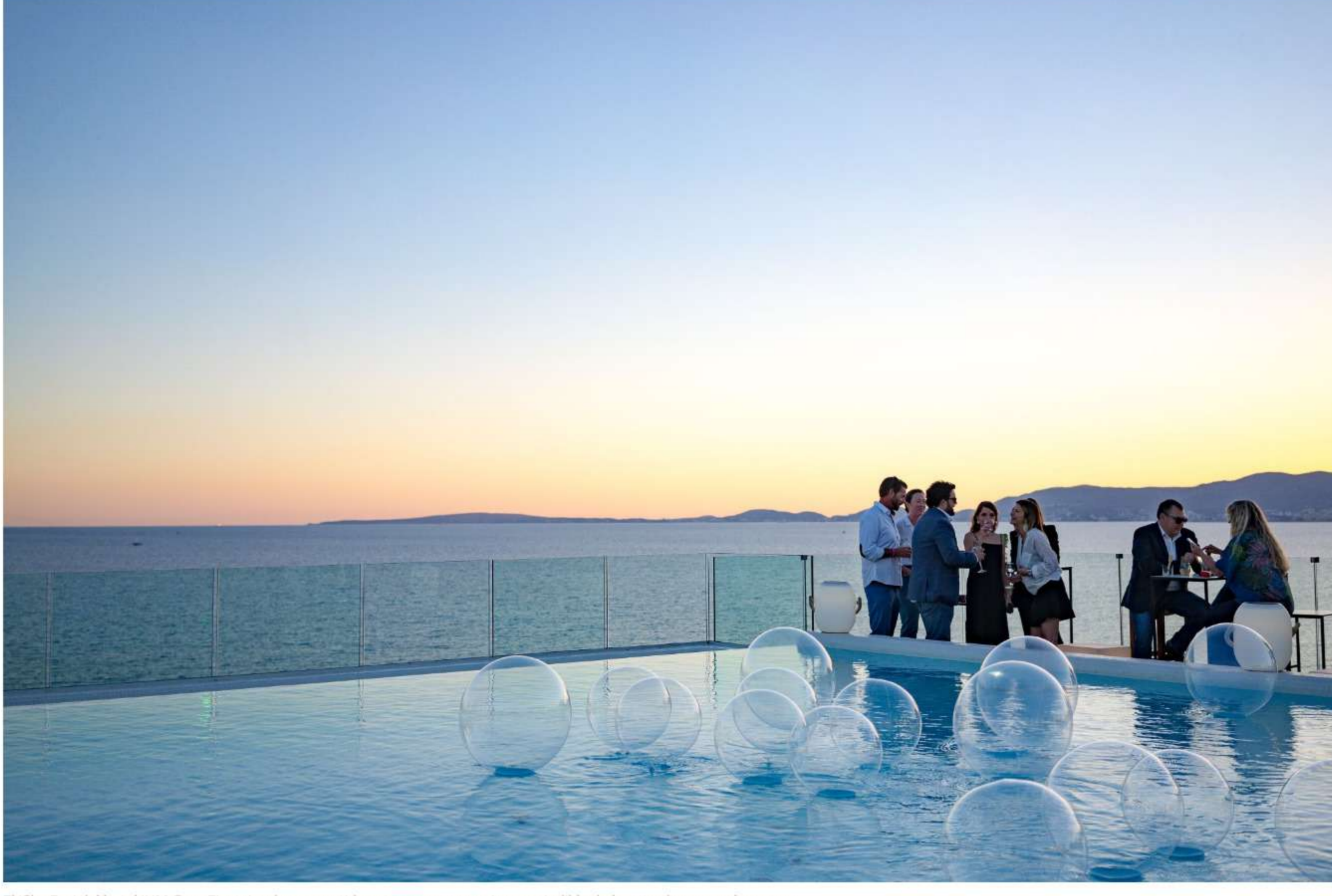
El 'Sky Bar' del hotel 'HM Gran Fiesta' se ha convertido este verano en un imprescindible de los atardeceres palmesanos.

Javier Fernández Ortega Texto y Fotografía