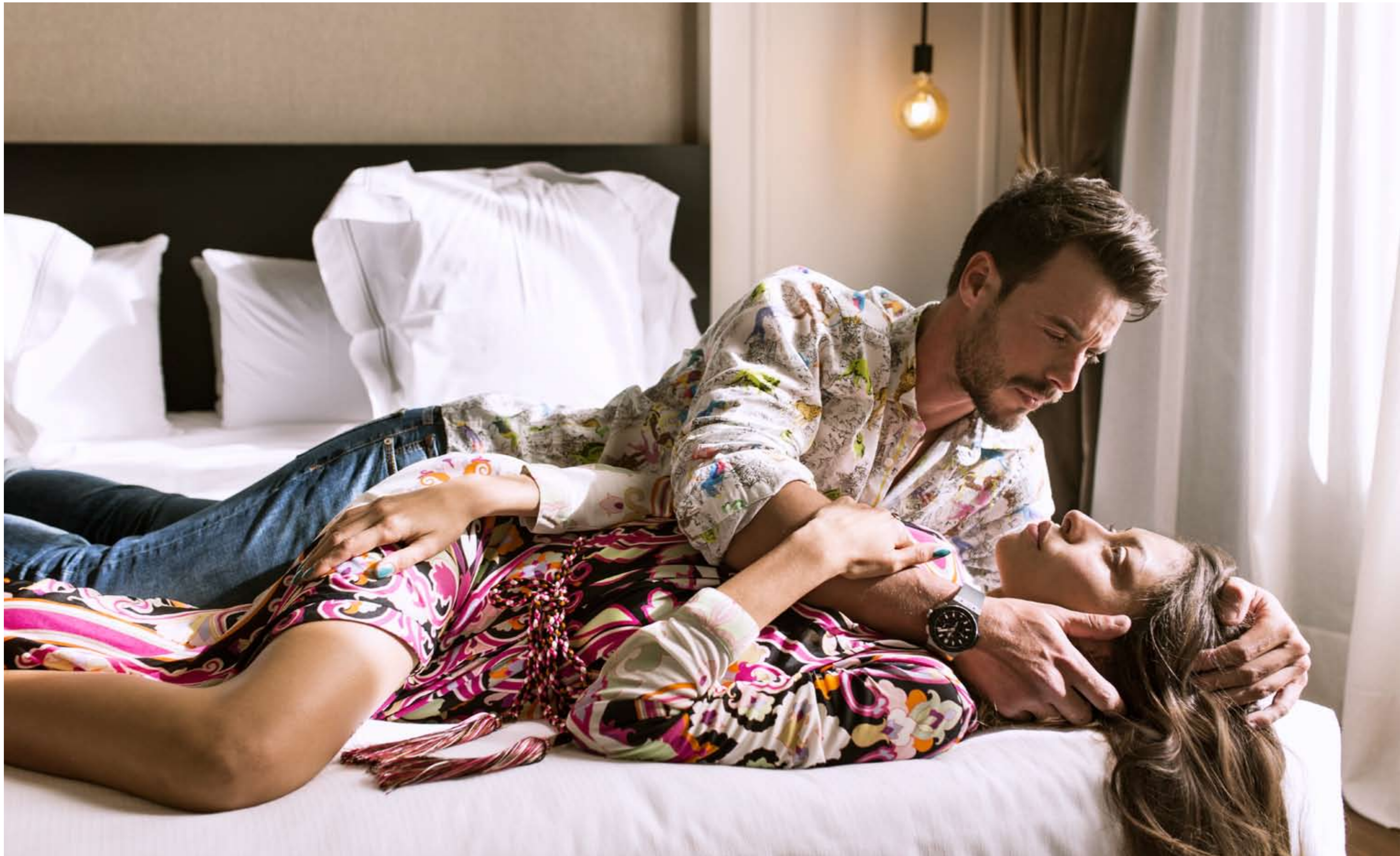
ÉL: Camisa ETRO (CORNER). Pantalón vaquero HACKETT. Reloj HUBLOT (RELOJERÍA ALEMANA). ELLA: Vestido ETRO (CORNER). Anillo PASQUALE BRUNI (RELOJERÍA ALEMANA).