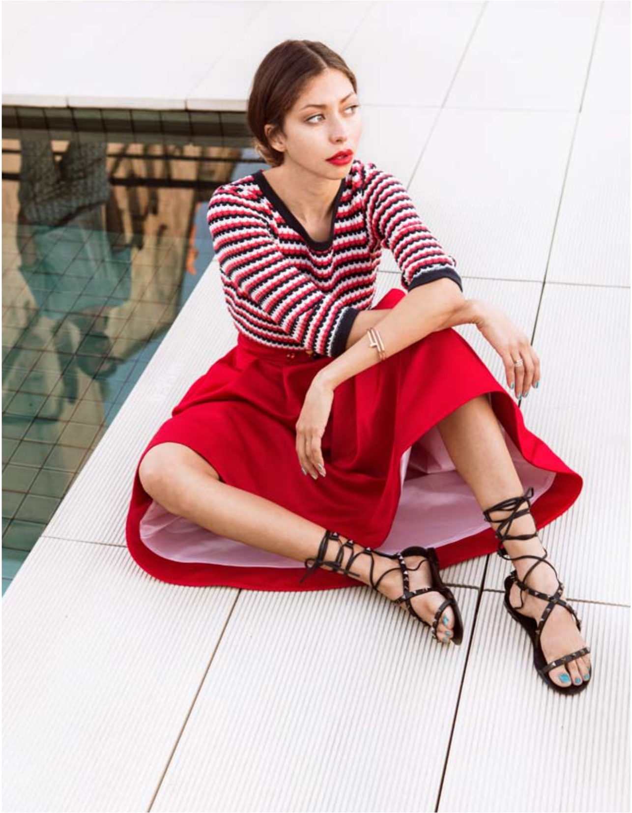
ELLA: Jersey TOMMY HILFGER. Falda LIU JO. Zapatos VALENTINO (CORNER). Pulsera y Anillo CARTIER (exclusividad Boutique Cartier Palma, Mallorca). ÉL (reflejo agua): Camiseta AVANT TOI (RIALTO LIVING). Pantalones ANTONY MORATO.