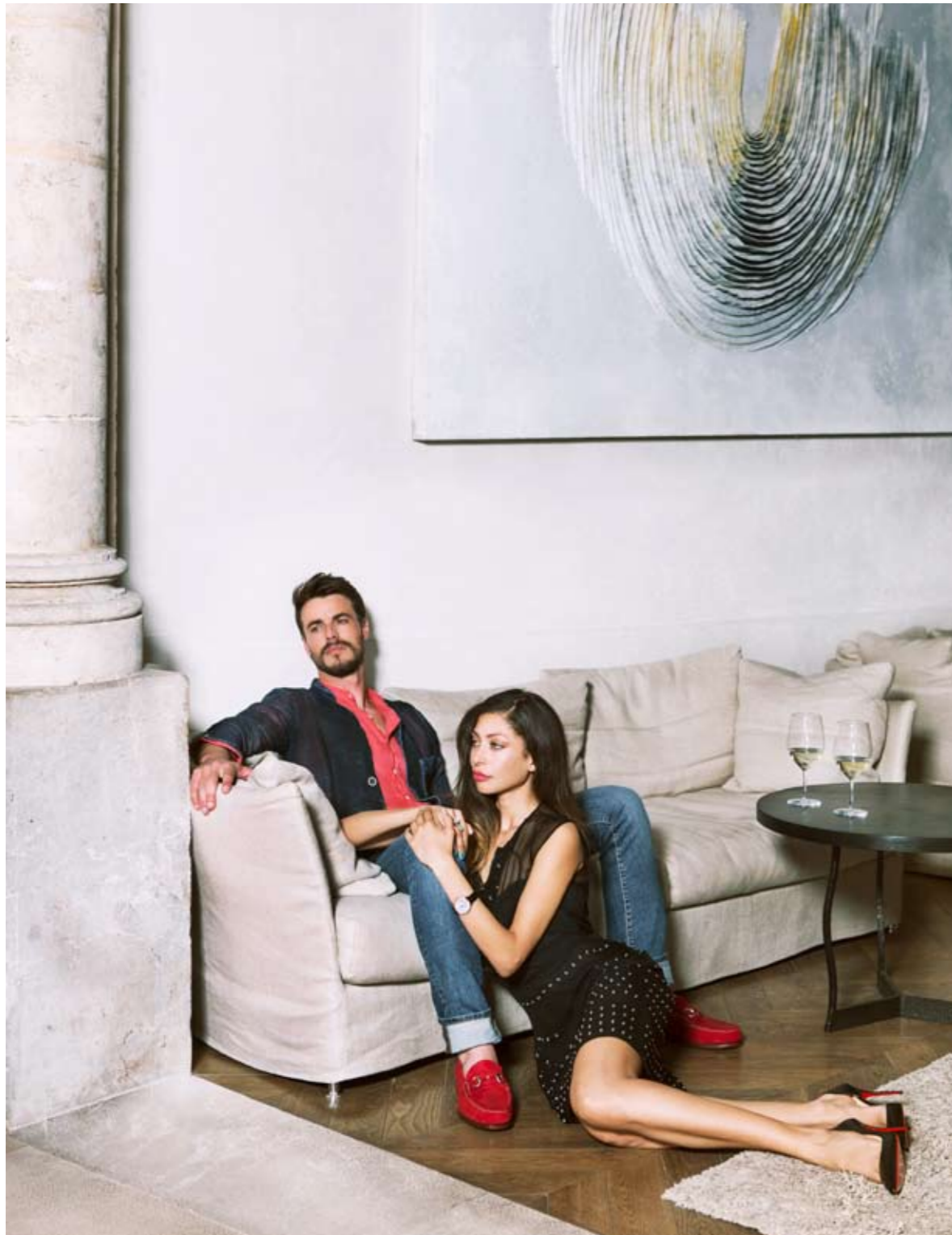
ÉL: Blazer AVANT TOI (RIALTO LIVING). Camisa ALTEA (RIALTO LIVING). Pantalón vaquero HACKETT. Zapatos CARMINA SHOEMAKER. ELLA: Vestido PRADA (CORNER). Zapatos CHRISTIAN LOUBOUTIN (CORNER). Reloj JAEGER-LeCOULTRE (RELOJERÍA ALEMANA). Anillos VHERNIER (RELOJERÍA ALEMANA).