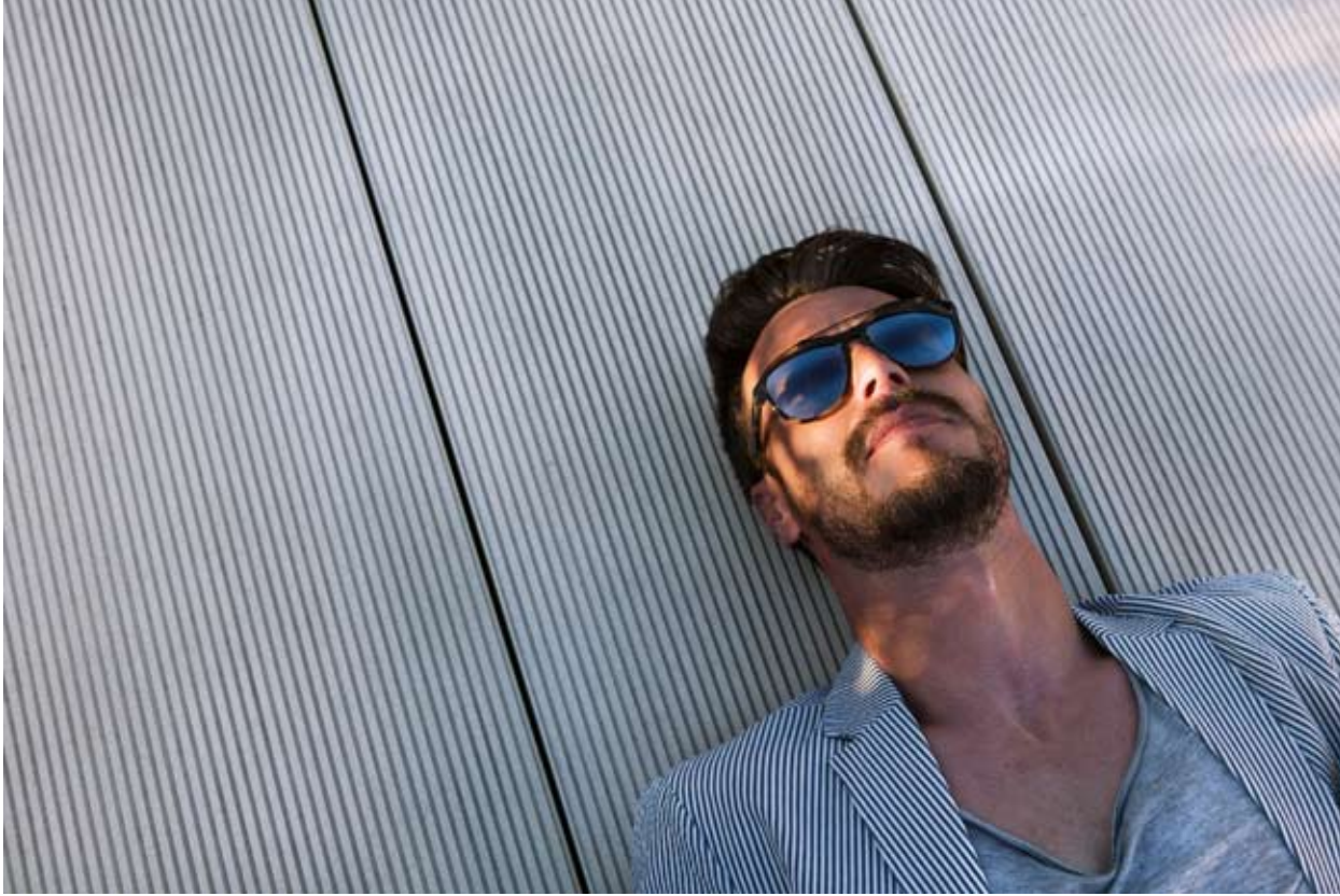
Americana ANTONY MORATO. Camiseta AVANT TOI (RIALTO LIVING). Pañuelo BRUNELLO CUCINELLI. Gafas de sol NUJIT (ÓPTICA TOSCANA).

“ El amor nace del recuerdo, vive de la inteligencia y muere por olvido ”