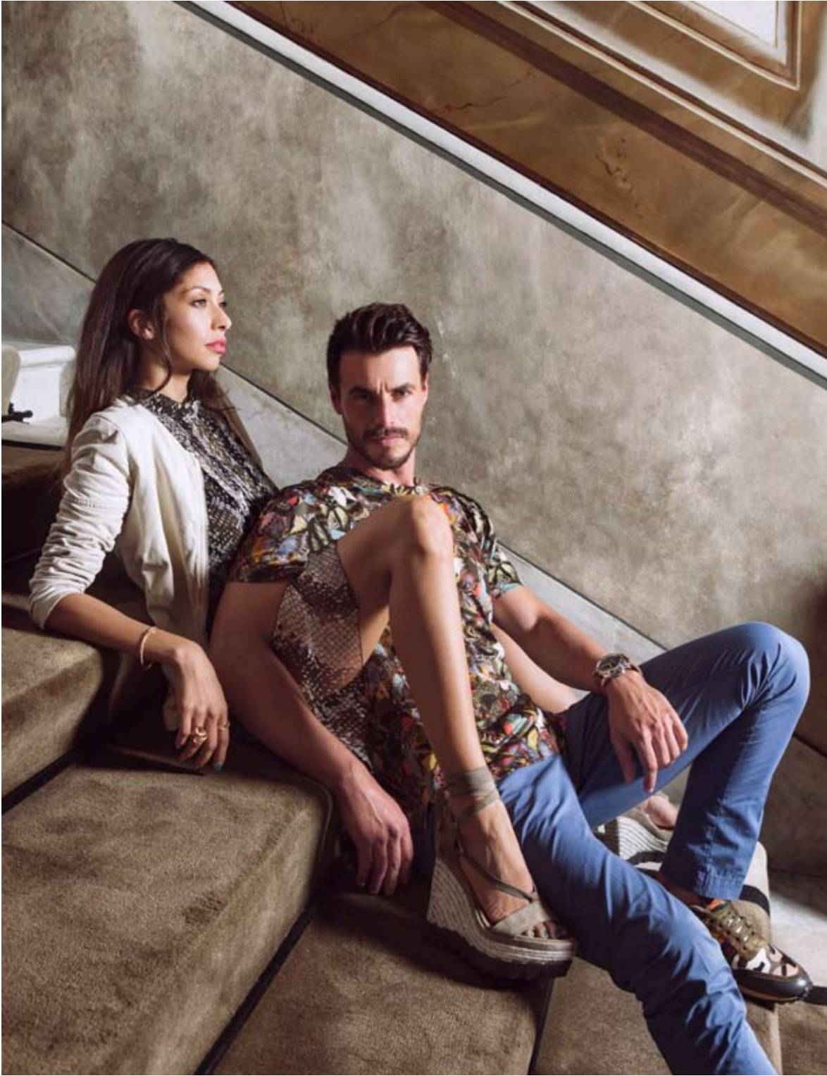
ELLA: Chaqueta de piel GIORGIO BRATO (RIALTO LIVING). Vestido PRADA (CORNER). Zapatos STUART WEITZMAN (CORNER). Pulsera y Anillos OLE LYNNGAARD (RELOJERÍA ALEMANA). ÉL: Camiseta VALENTINO (CORNER). Pantalón vaquero HACKETT. Deportivas VALENTINO (CORNER). Reloj PANERAI (RELOJERÍA ALEMANA).