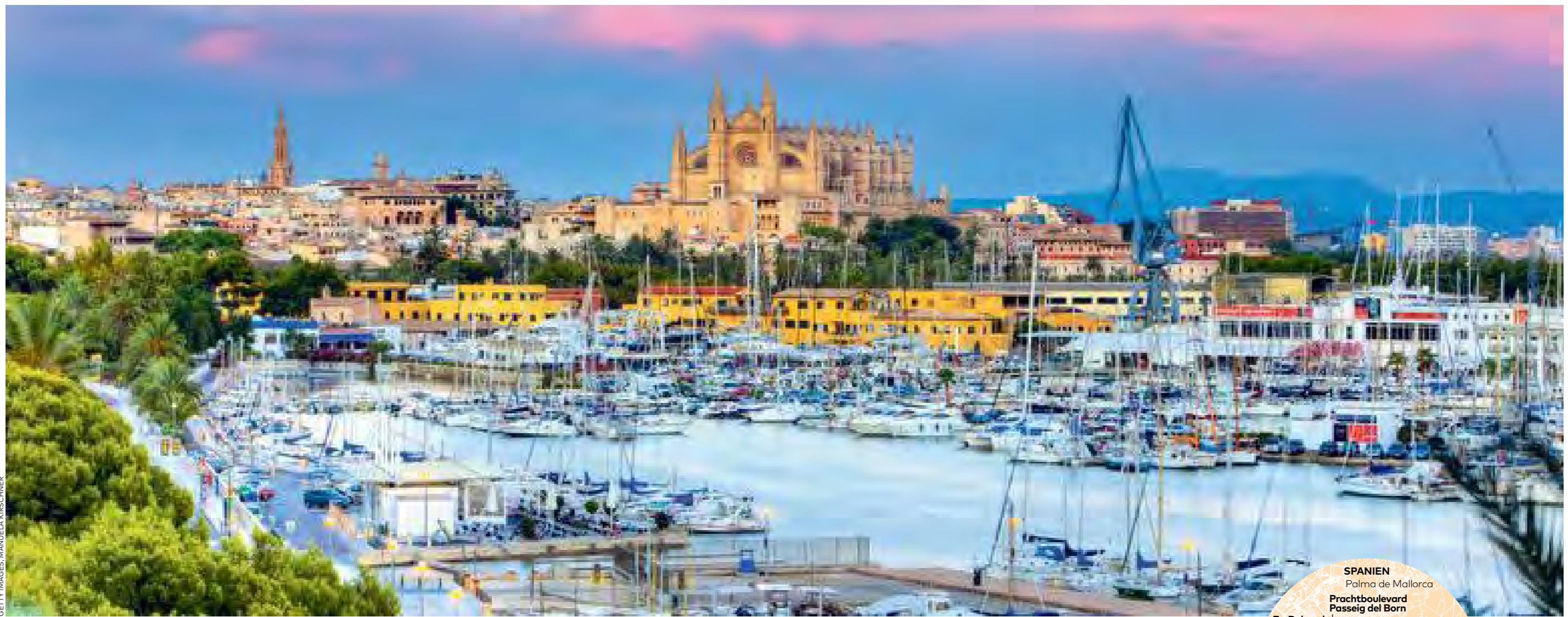
Da will man hin: Blick über den Hafen auf die Kathedrale von Palma