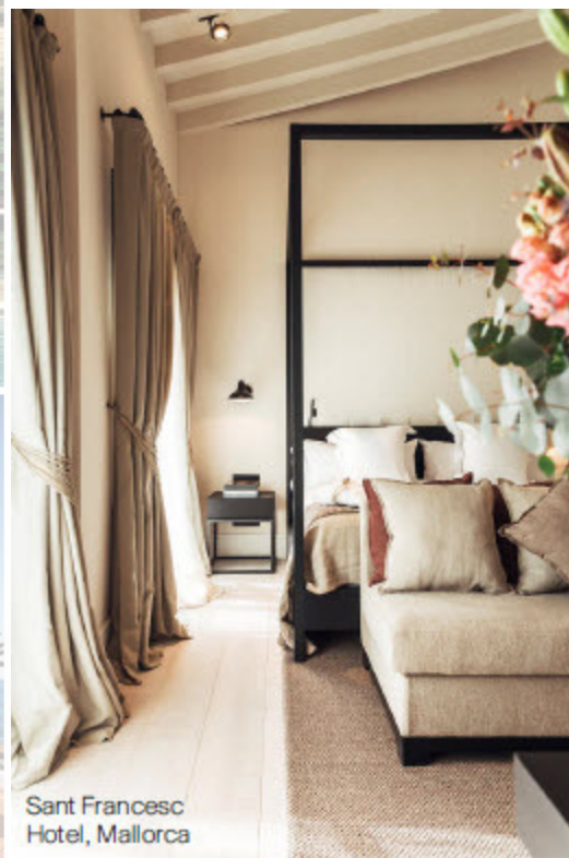
Sant Francesc Hotel, Mallorca