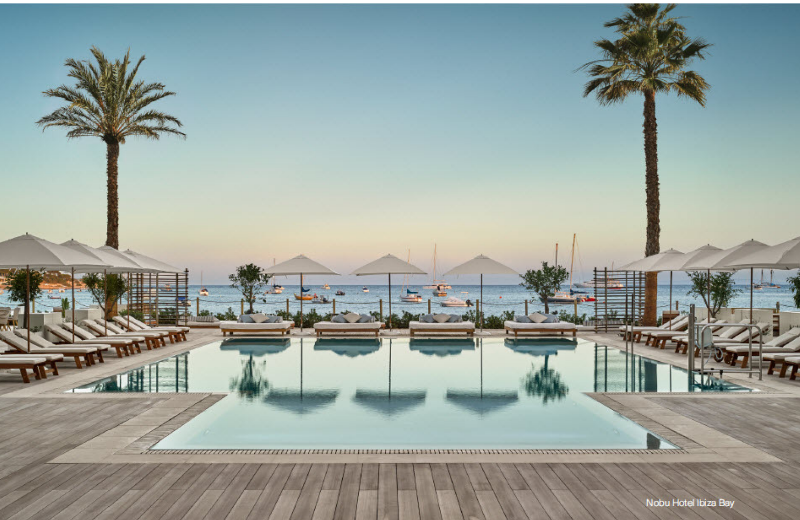
Nobu Hotel Ibiza Bay