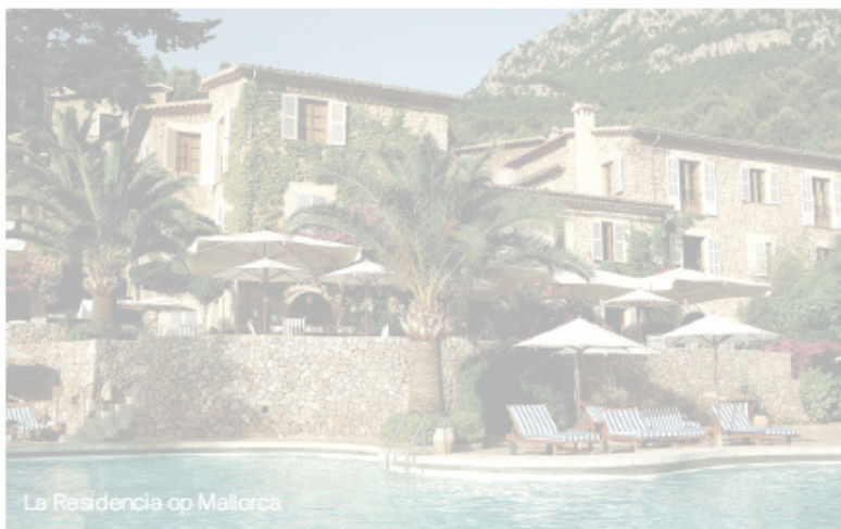
La Residencia op Mallorca

Aan te bevelen is een siësta op een van de ligstoelen naast het stille zwembad op het dakterras